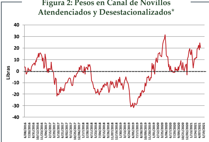
Figura 2: Pesos en Canal de Novillos Atendidos y Desestacionalizados*

*Nota: Los valores del gráfico están expresados en dólares estadounidenses (USD)